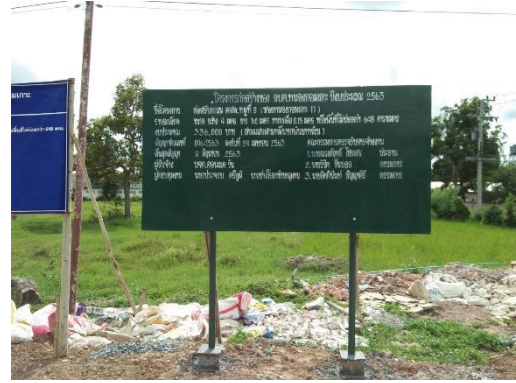
ก่อสร้างถนน คสล.หมู่ที่ ๙ (ซอยหนองกอมเกาะ ๑๑)