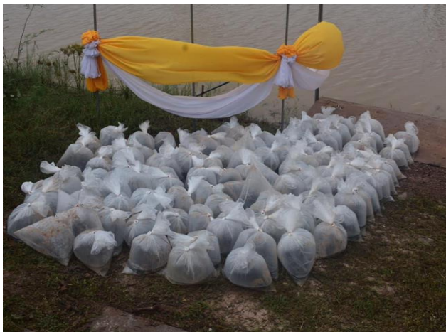
โครงการปล่อยพันธุ์ปลาเพื่อเพิ่มผลผลิตและอนุรักษ์ทรัพยากรประมงในหนองกอมเกาะ