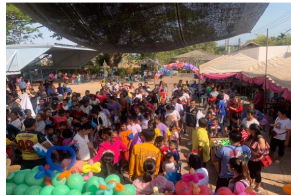
โครงการจัดงานวันเด็กแห่งชาติ