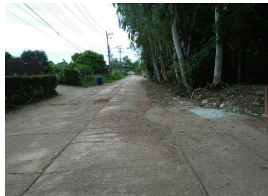
ก่อสร้างรางระบายน้ำ คสล. หมู่ที่ ๗ (ชอยหนองเดิน ๘)