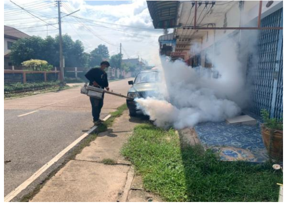
โครงการป้องกันและควบคุมโรค