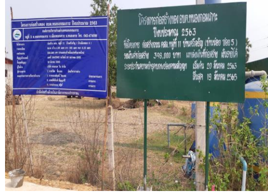
ก่อสร้างถนน คสล. หมู่ที่ ๑๑ (บ้านน้อยชอย ๕)