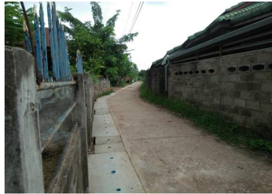
ก่อสร้างรางระบายน้ำ คสล. หมู่ที่ ๖ (ชอยโนนธาตุ ๘)