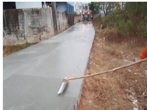
ก่อสร้างถนน คสล. หมู่ที่ ๒ (ซอยนาไก่ ๑/๒)