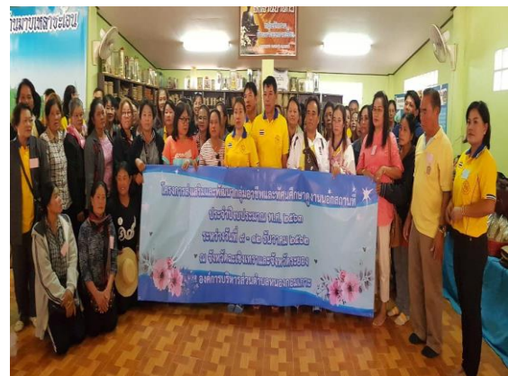
โครงการส่งเสริมและพัฒนาบุคลากรท้องถิ่นฯ