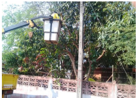
โครงการปรับปรุงภูมิทัศน์ภายในตำบล