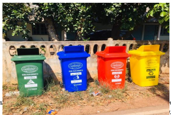
รายงานผลการติดตามและประเมินผลแผน